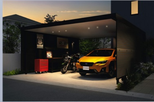
灯りに照らされた木々の葉が癒しを与える・・・