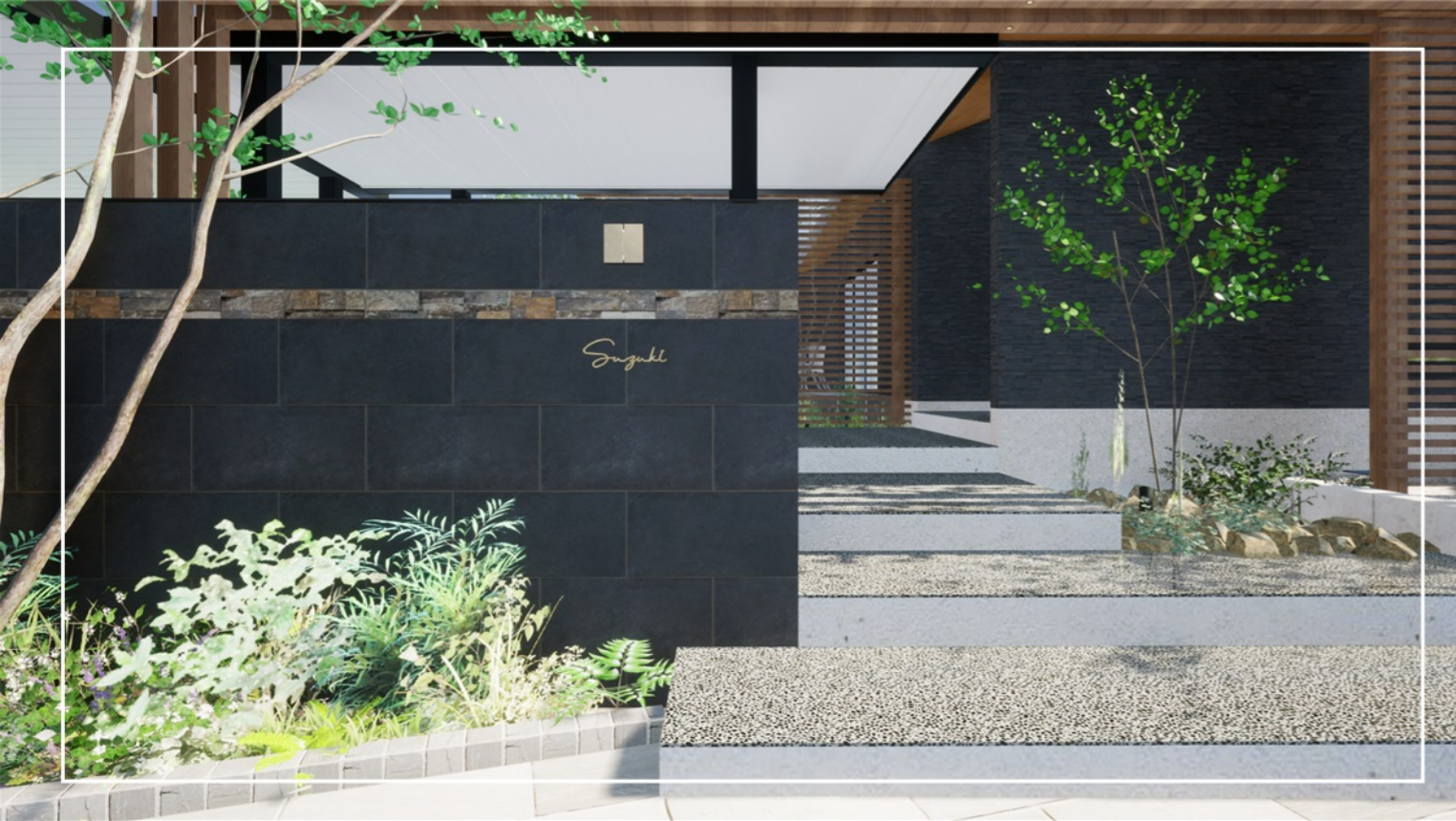
黒のタイル貼りの門袖に、真鍮のTAKAOKA MADEの門灯が大人可愛い