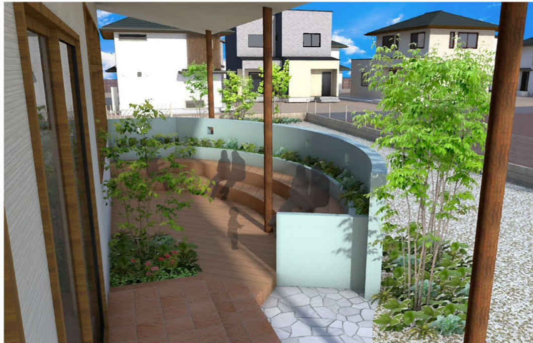
カフェのデッキテラス

ここは非常時の防災公園としても利用されます。 期間限定ではありますが、グラウンドではキャンプをすることができます。日中は楽しいイベントも用意していますので、たのしみに来てください！